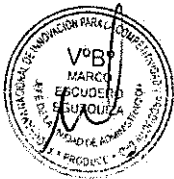
MODELO DE FOLIACIÓN: