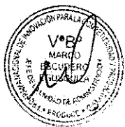
MODELO DE FOLIACIÓN: